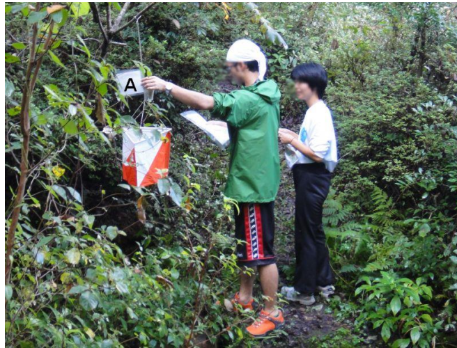
フラッグと識別記号【A】、メンバーが写るように写真撮影して下さい